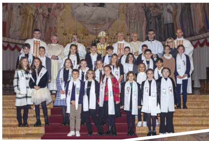
GRUPPO DI FONTANA PRIMA COMUNIONE E CRESIMA