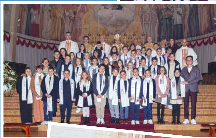
GRUPPO DI PIEVE PRIMA COMUNIONE E CRESIMA