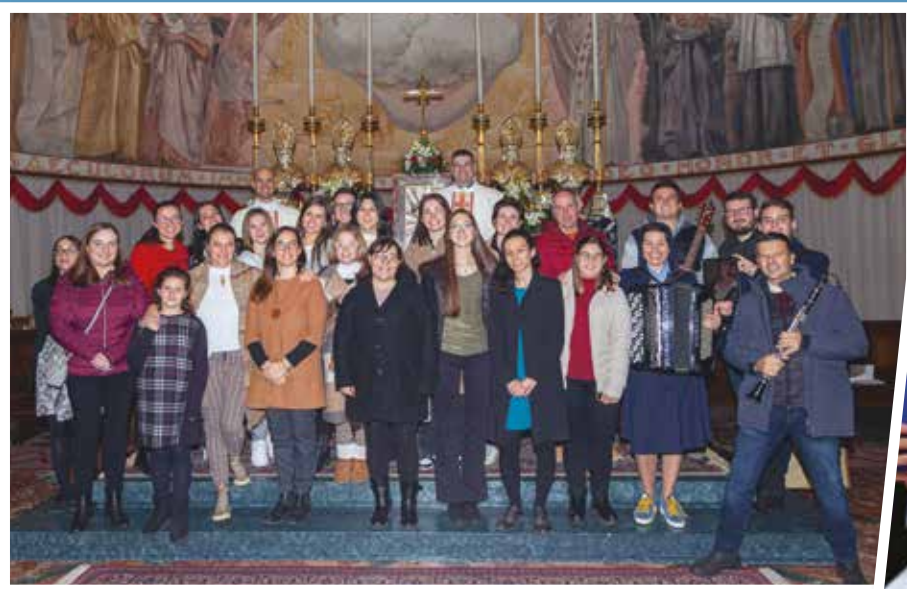
IL CORO DEI GIOVANI DELL'UP