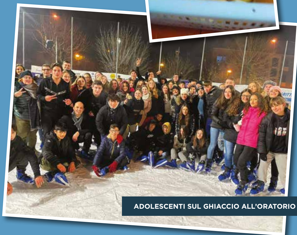
ADOLESCENTI SUL GHIACCIO ALL'ORATORIO DI REZZATO