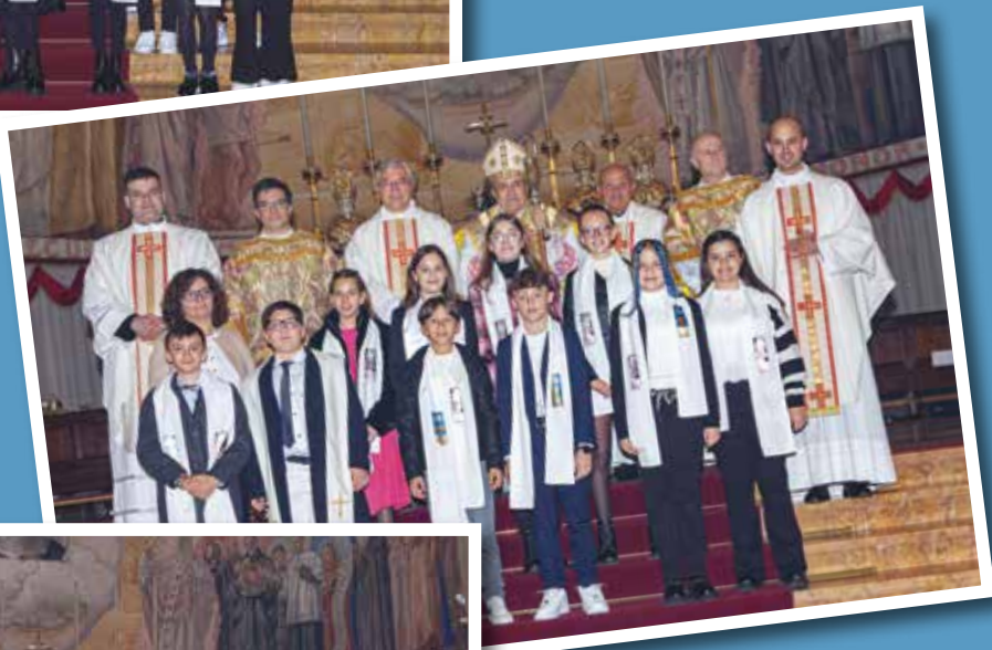
GRUPPO DI GAZZOLO PRIMA COMUNIONE E CRESIMA