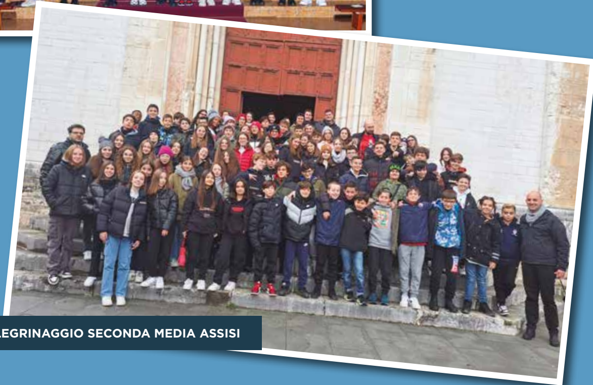
PELLEGRINAGGIO SECONDA MEDIA ASSISI