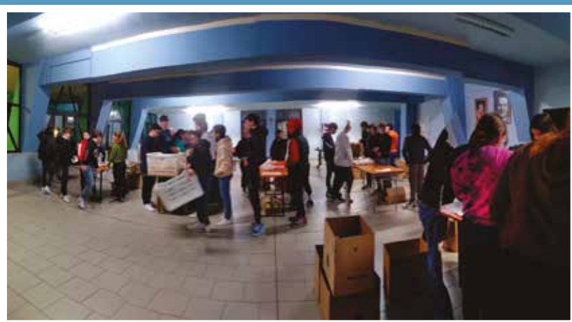
LA GIORNATA DEL PANE